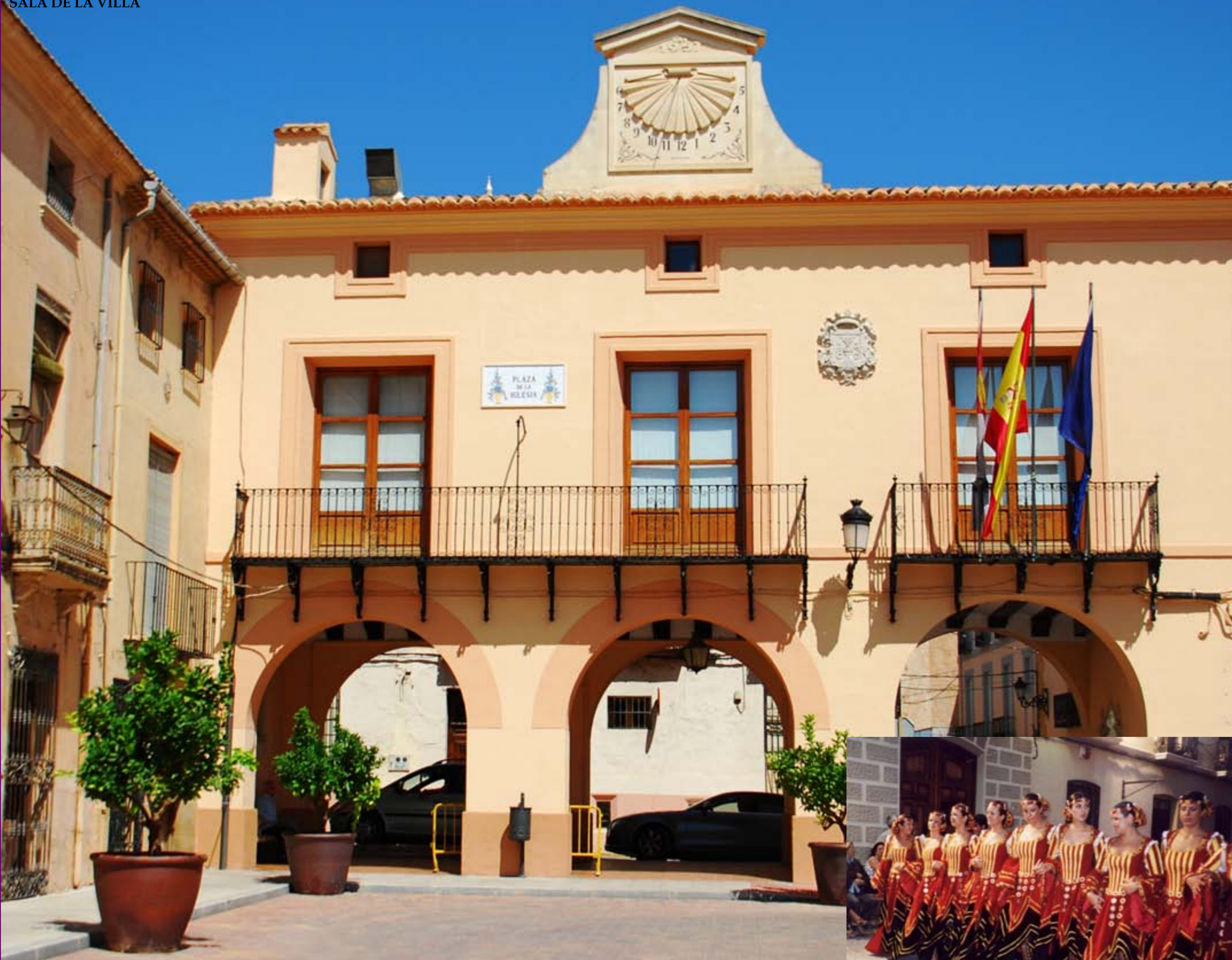
FIESTAS DE MOROS Y CRISTIANOS

En el extremo oriental de la región, participando del paisaje de las hoyas y depresiones bético-levantinas, se encuentra el corredor de Caudete, en la cabecera del río Vinalopó y en el piedemonte de la sierra de La Oliva. Caudete es el menor de los núcleos urbanos de la provincia de Albacete y el que tiene mayor afinidad cultural con las ciudades valencianas. Se caracteriza por una población rejuvenecida y adulta, que tiene sus ocupaciones principales en las actividades del sector secundario, la industria y la construcción. La tasa de feminidad es semejante a la media provincial, predominando la población masculina. Caudete posee un rico patrimonio natural, cultural y etnográfico. Un reloj solar preside la plaza de la iglesia, sobre la Sala de la Villa, histórico inmueble que hizo funciones de sala capitular en otros tiempos. Gran importancia cultural tienen también el Museo de acuarela de Rafael Requena y las fiestas de Moros y Cristianos, unas de las más inveteradas de España.