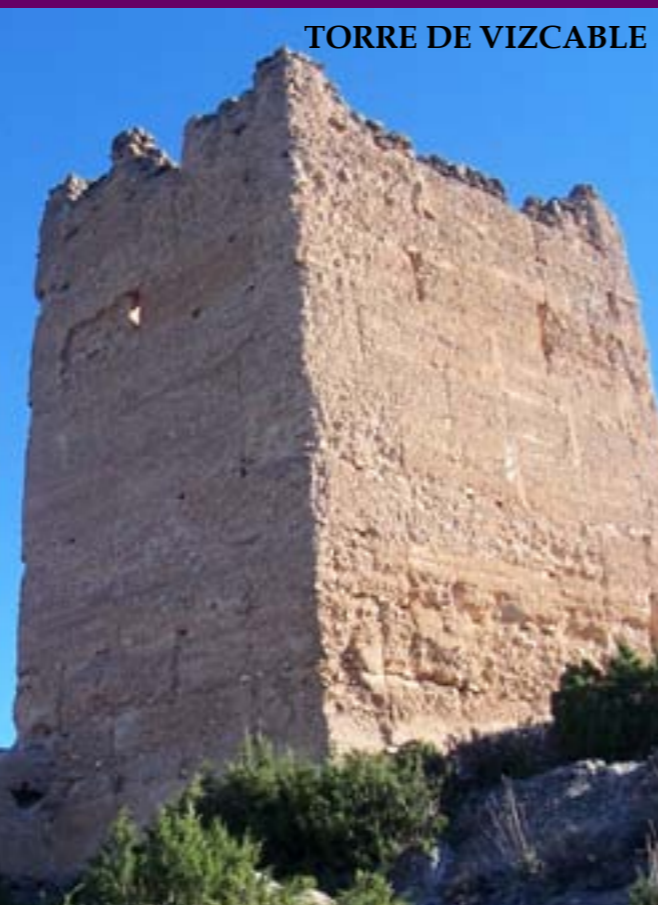
TORRE DE VIZCABLE