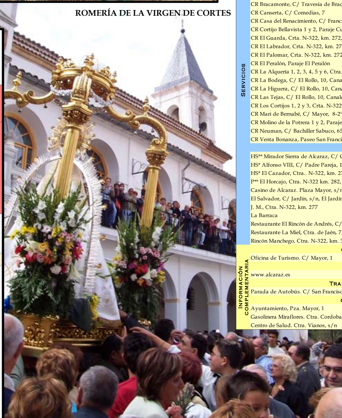
ROMERÍA DE LA VIRGEN DE CORTES