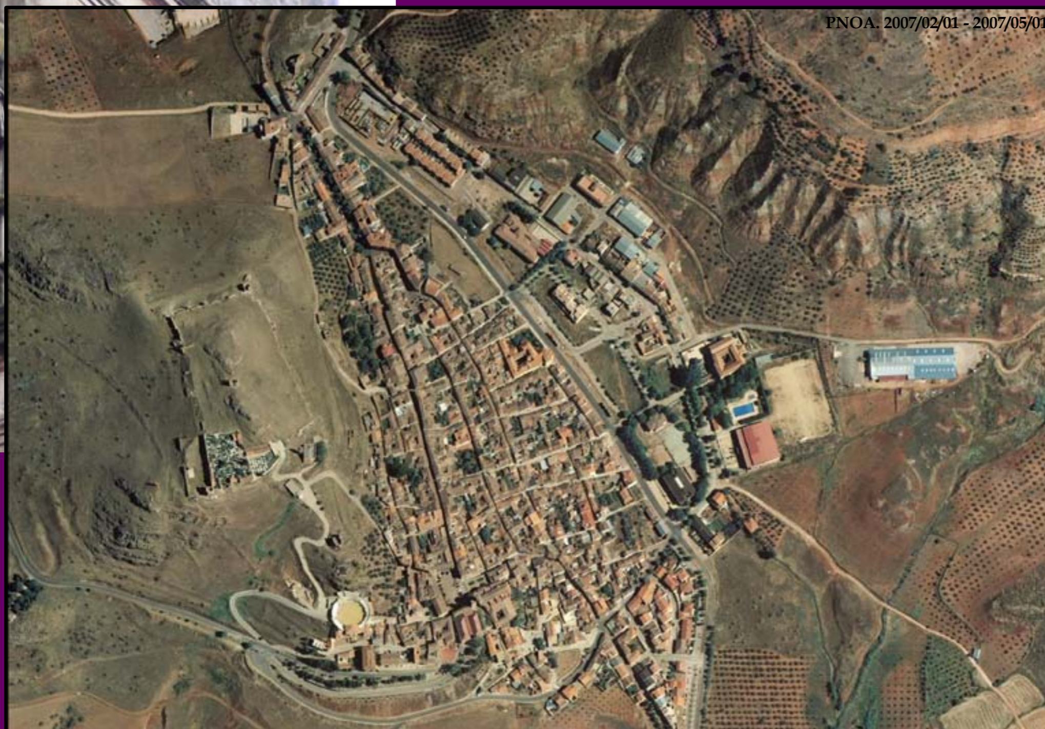
PNOA. 2007/02/01 - 2007/05/01

De considerable extensión y reducido número de habitantes, Alcaraz, bella población histórica, está emplazada sobre un promontorio desde el que se contemplan hermosas vistas del paisaje característico de los Valles y Corredores intramontañosos Béticos. En otros tiempos cabeza de un extenso alfoz, hoy es una pequeña ciudad de indudable valor por su patrimonio histórico y natural. La herencia cultural se siente al pasear por sus calles estrechas y admirar sus ennoblecidas fachadas, con la impronta de Andrés de Vandelvira. De singular belleza es la plaza Mayor renacentista, construida junto a la iglesia gótica, de la Trinidad. A las afueras se levanta el Santuario de Nuestra Señora de Cortes, lugar de peregrinación de toda la comarca. En Alcaraz, centro comarcal y administrativo, destacan los empleos del sector servicios, especialmente los relacionados con el turismo. En la estructura demográfica predomina la población adulta y una tasa de feminidad mayor que la media provincial.