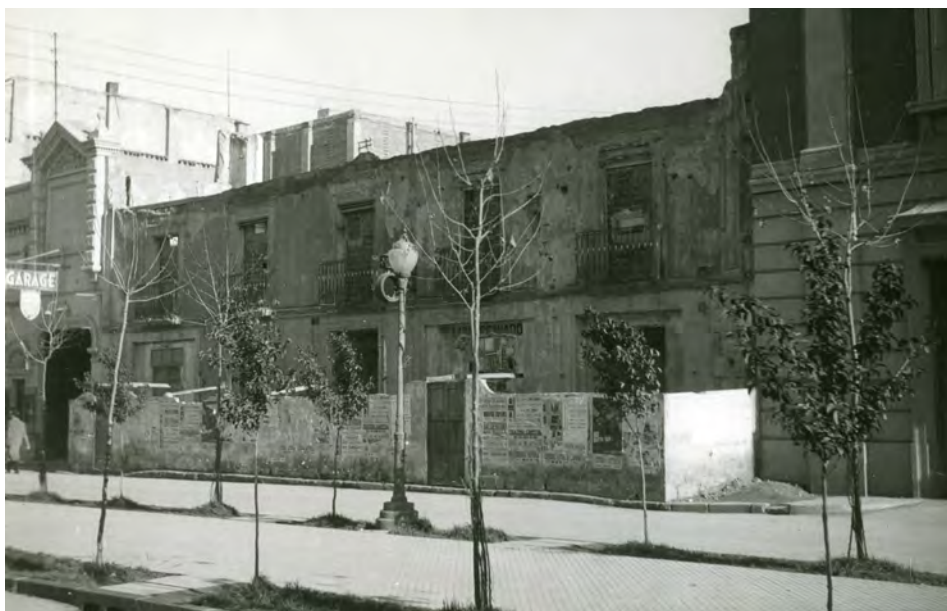
Fotografía 10.- Instantánea posiblemente de los años cuarenta, ya que cuando se tramitó el expediente (1951) se menciona el “solar” colindante. A la derecha de la fotografía aparece la Audiencia Provincial y a la izquierda el acceso al garaje del edificio objeto de este trabajo. Instituto de Estudios Albacetenses. Archivo Fotográfico, Registro 0714 . Autor Jaime Belda.