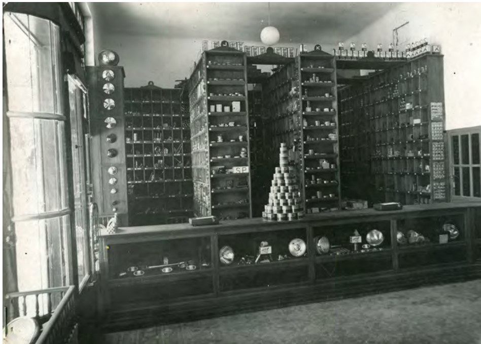
Fotografía 16. Interior del comercio de venta de accesorios de vehículos. Expediente para la inclusión ..... Fotografías en carpeta I nº. 5 AMAB, Leg 853.