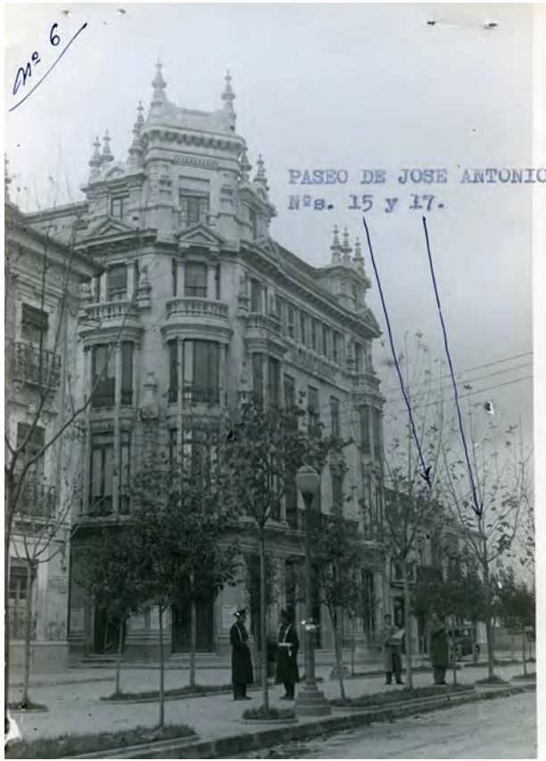
Fotografías 11 y 12. Margen izquierda del Paseo de José Antonio, incorporadas al expediente a fin de argumentar que existían efectivamente inmuebles de baja altura y que “desmerecían” frente a su negocio que sí estaba en “decoración” con el resto de los colindantes Expediente para la inclusión... Fotografías en carpeta II nºs. 6 y 7 AMAB, Leg 853.