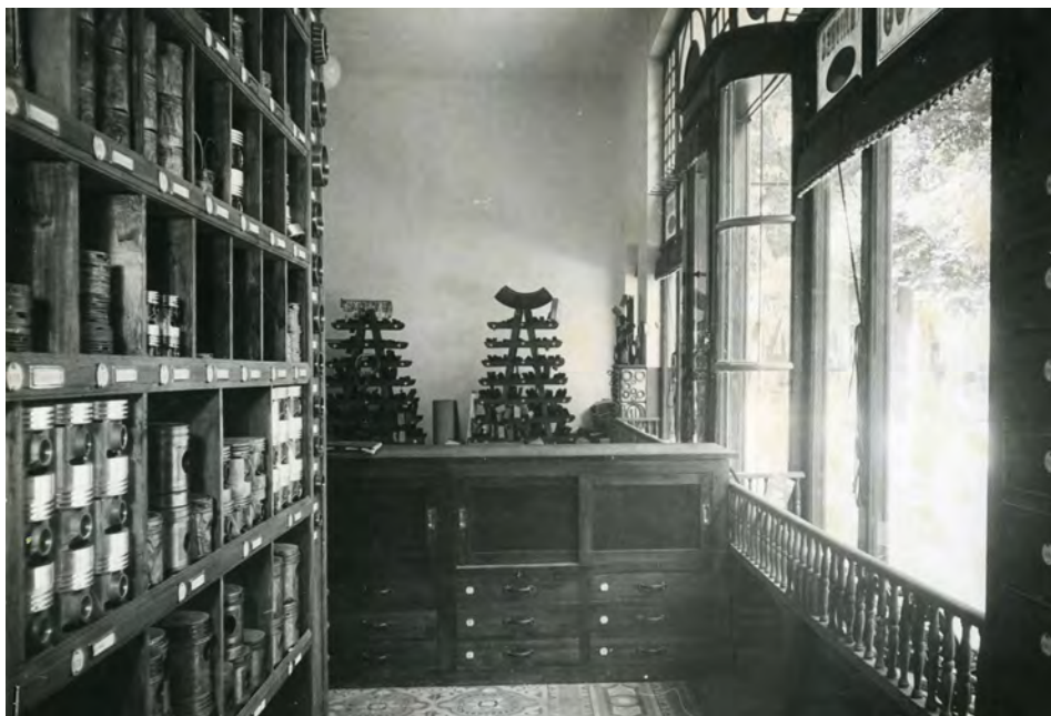
Fotografía 13. Interior del comercio. Expediente para la inclusión ..... Fotografías en carpeta I nº. 1 AMAB, Leg 853.