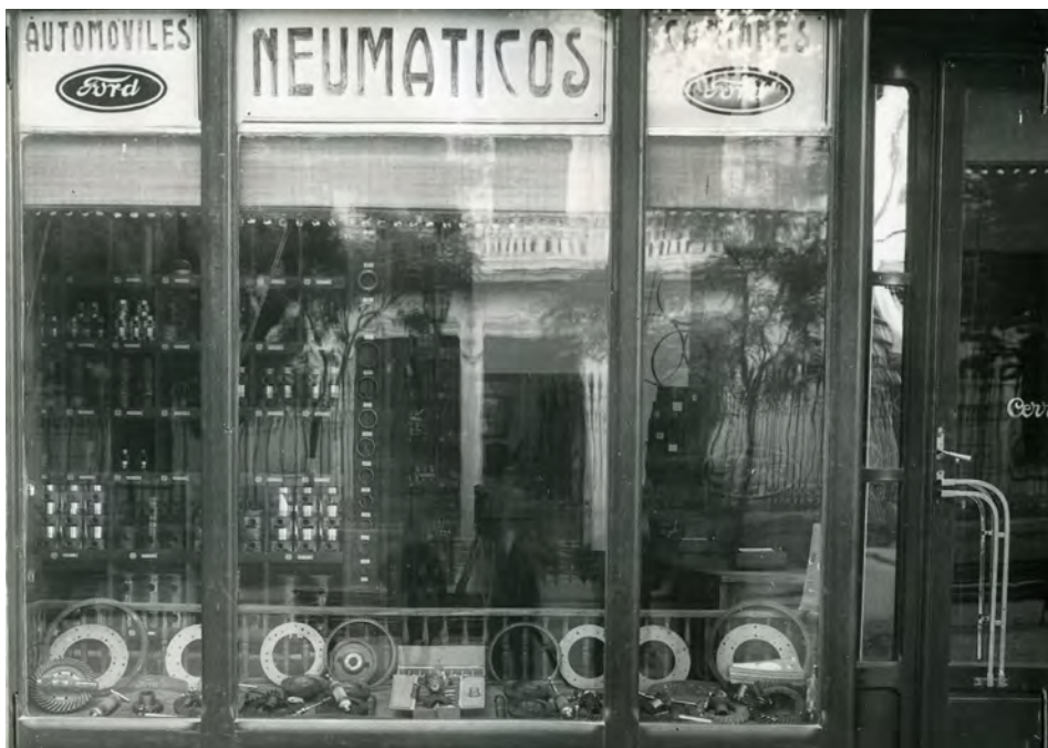
Fotografía 14. Escaparate del comercio. Reflejado en sus cristales observamos la fachada principal de acceso al Palacio de la Diputación Provincial y en el centro de la instantánea el fotógrafo. Expediente para la inclusión ..... Fotografías en carpeta I nº. 3 AMAB, Leg 853