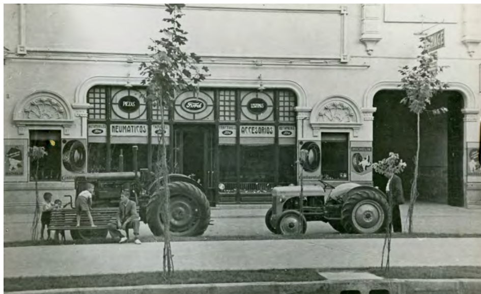
Fotografía 2. Fachada del comercio de venta de neumáticos y accesorios de la Casa Ford. Acceso a comercio y al taller. (actual Paseo de Libertad ). Expediente para la inclusión ..... Fotografía en carpeta I nº. 8 AMAB, Leg 853.