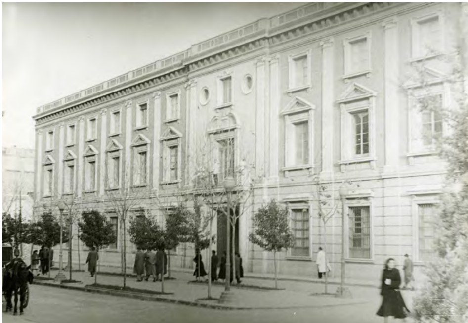
Fotografías 9. Palacio de la Audiencia Territorial correspondiente al num. 2 del entonces Paseo de Jose Antonio. Expediente para la inclusión ..... Fotografías en carpeta III nº. 2 AMAB, Leg 853.