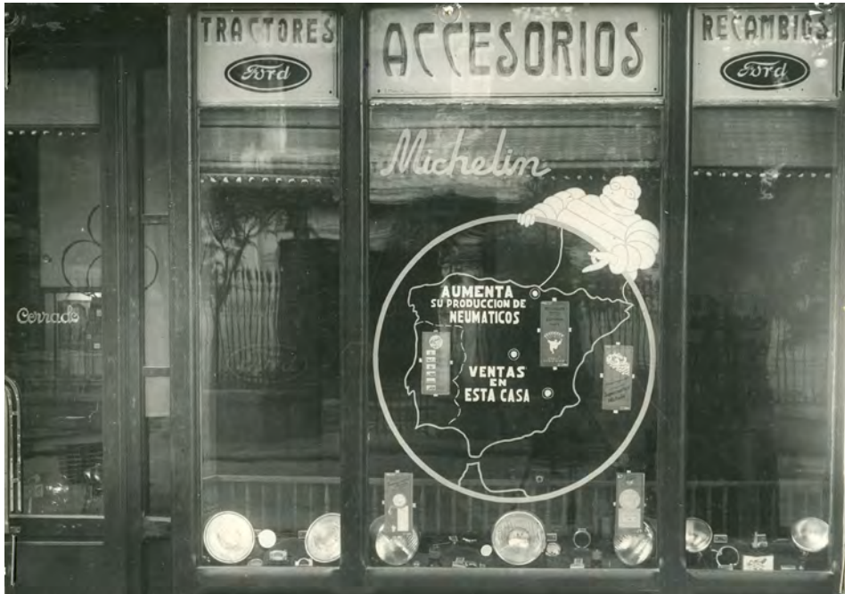
Fotografía 15. Escaparate exterior del comercio. Expediente para la inclusión ..... Fotografías en carpeta I nº. 4 AMAB, Leg 853.