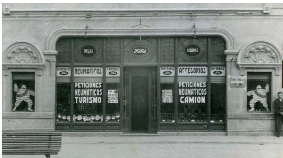
Fotografía 3. Fachada del comercio de venta de neumáticos y accesorios de la Casa Ford. Acceso a comercio. (actual Paseo de Libertad ). Expediente para la inclusión ..... Fotografía en carpeta I nº. 7 AMAB, Leg 853.