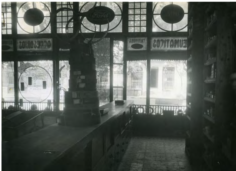
Fotografía 17. Desde esta perspectiva podemos observar en la cristalera de la izquierda lo que es la entrada al Palacio de la Diputación Provincial, y a la derecha la entrada al negocio de "Fotografía Giner". Expediente para la inclusión ..... Fotografías en carpeta I nº. 6 AMAB, Leg 853.