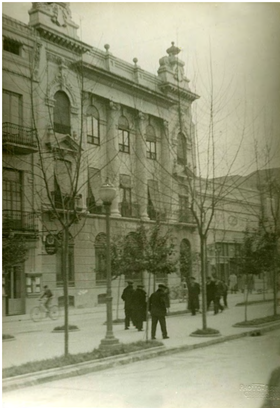
Fotografía 8. Vista del edificio colindante al negocio de Eduardo Navarro Armero, actualmente es un nueva edificación con la instalación de una entidad bancaria. Expediente para la inclusión ..... Fotografías en carpeta III nº. 1 AMAB, Leg 853.