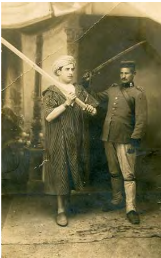
Royal (¿1920?). Generales moro y cristiano.

Dos personajes humanizaban el espectáculo: la Cristianilla, hija del general cristiano y la Morita, que lo era del general moro. En algunas representaciones el párroco local también se reservaba su papel, que generalmente era el de bautizar a la tropa infiel tras su derrota final. Las gracias de las tropas al Ayuntamiento pocas veces faltaban.