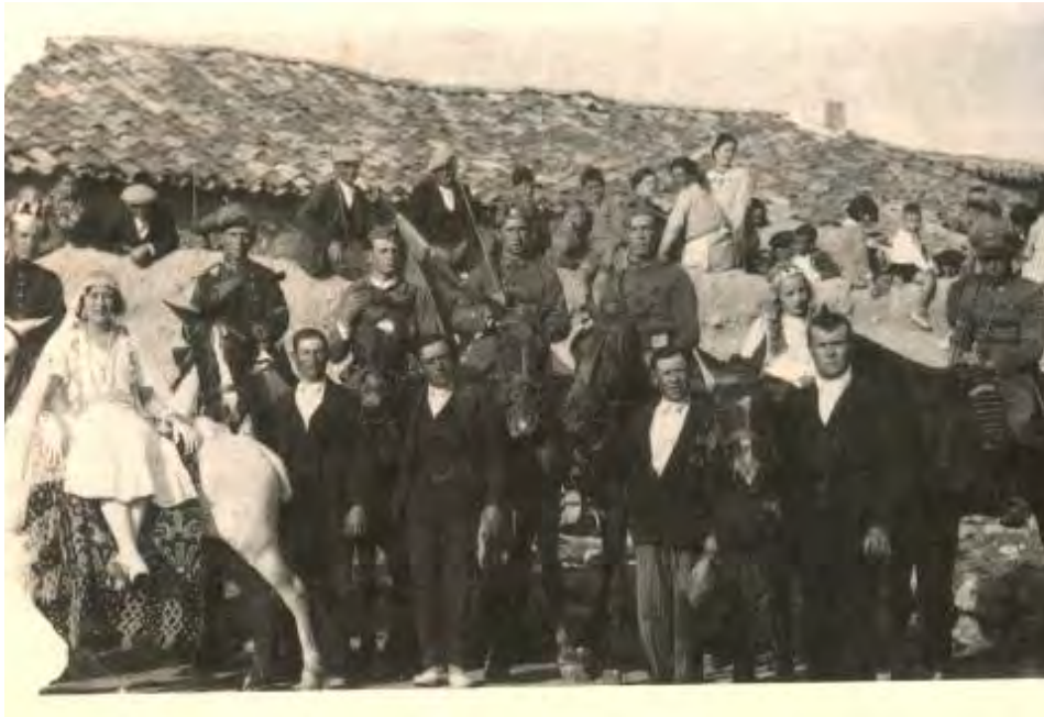
Foto particular (hacia 1925). Comparsa cristiana ataviada con los uniformes del Ejército español. La Cristianilla en primer plano y en segundo el Ángel, personajes que nunca debían faltar.

Por Real Cédula en 1776, quedaban suprimidas las cofradías, excepto las sacramentales, pues se trataba de frenar el importante poder económico que estaban adquiriendo, ganancias que se iban acumulando en sus arcas por las donaciones que recibían y por sus actividades durante las celebraciones patronales (donaciones, rifas, venta de medallas, escapularios, estampas religiosas, tortas consagradas, limosnas, pujas de los mozos por entradas del santo patrón en el templo, etc.), sin otro control sobre ellas que el de sus mayordomos, ganancias que contrastaban con los escasos beneficios que de aquellos festejos obtenían las parroquias y municipios.