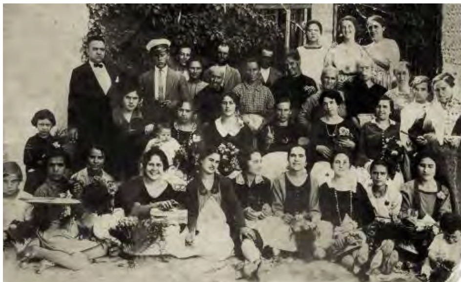
Día del Patrón San Agustín. Una familia ibañesa y su servidumbre celebrándolo en privado.