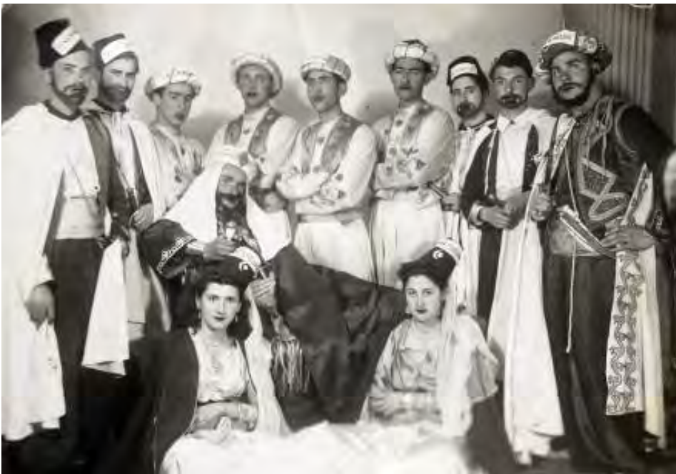
Comparsa árabe en un momento de descanso.

Las comparsas de moros y cristianos representadas en la comarca ibañesa corresponden a la tipología andaluza.