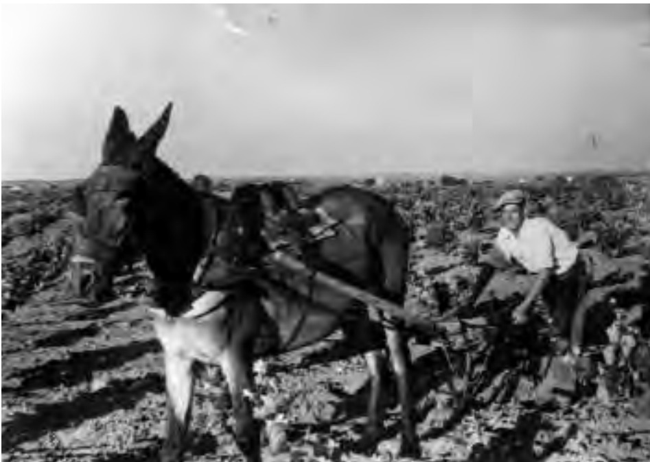
Arado con vertedera. Se utilizó hasta que se introdujo la maquinaria en las faenas del campo.