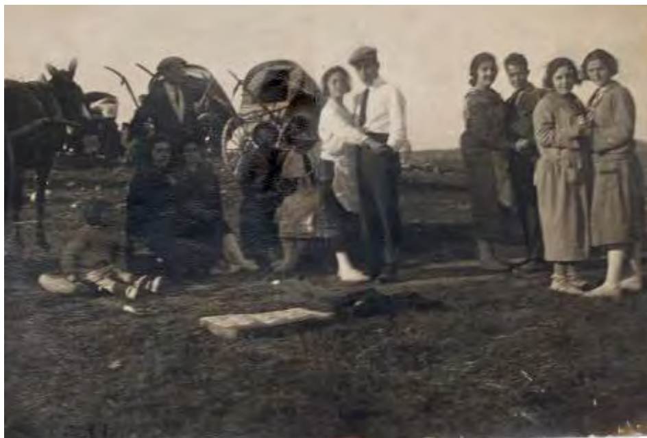
Foto particular. Campamento de los feriantes. Situaban sus carros en las inmediaciones de la Cañada, al final del paseo de la Feria, próximo a la carretera que va a Villamalea y a Cuenca.

Como dato anecdótico queremos señalar que en el año 1889 un grupo de jóvenes, con la ayuda de las autoridades municipales, consiguieron