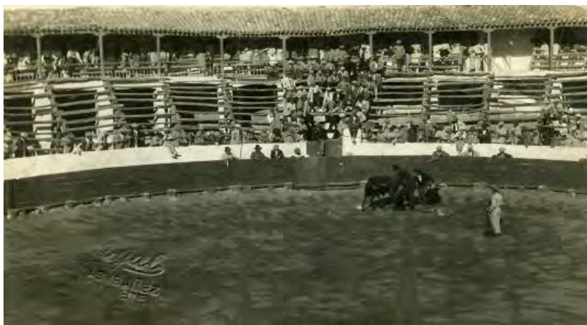
Feria de 1922. Charlotada a cargo de los toreros Lerín, Charlot y el Guardia Torero en la primera plaza de toros de la villa. Puede verse su estructura soportada a base de pies derechos con zapatas y sus asientos de tabloncillo apoyados en burros de mampostería.

Por otra parte, la plaza de toros además de conseguir las finalidades propuestas también dotaba de mayor rasgo ornamental a Casas Ibáñez, que trataba de conseguir atraer a ella a los vecindarios de las poblaciones más cercanas, intento que resultaba fundamental para una villa que acababa de ser nombrada cabecera de comarca y como tal quería ser reconocida por sus convecinos.