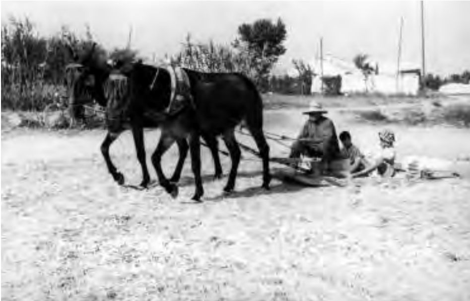
Foto particular. Años 50. La trilla de la mies, con trillo de madera y lascas de pedernal.