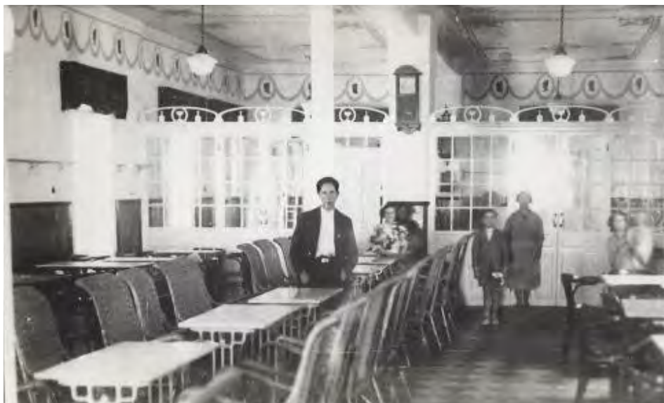
Foto Villena. A6os 30. Sal6n La Gloria, donde las clases populares celebraban sus festejos. Fue escenario de los juicios militares de responsabilidades pol3ticas despu3s de la pasada guerra civil.

As3 se deja ver en los repetidos comentarios que incluye la prensa local en sus p3ginas a comienzos del siglo XX, haci3ndose eco del feliz encuentro despu3s de tantos a6os de alejamiento: "Casas Ib3a6ez ha experimentado una verdadera revoluci3n en psicolog3a fundamental que trae preocupado al elemento clerical.