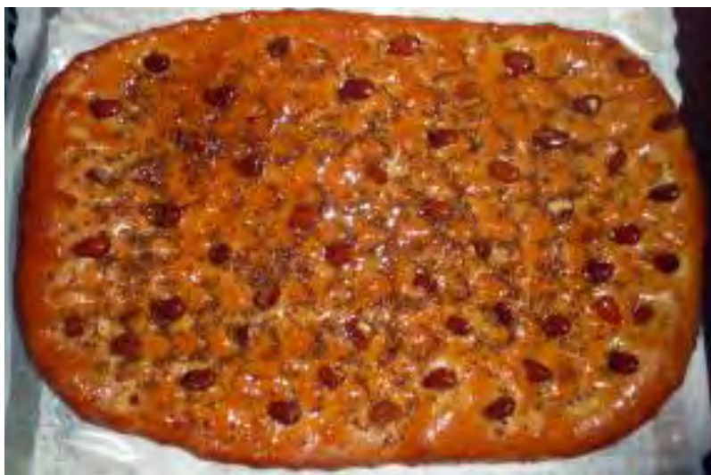
El Pan Bendito

Así pues, creemos que por ser el pan bendito un alimento considerablemente energético y poco perecedero, es oportuno pensar que la torta fuera considerada como insustituible por los trajineros como fuente alimentaria, fundamental en su intendencia para sus larguísimas jornadas de viaje, alejados de sus hogares. Por otra parte, era costumbre desde muy antiguo que las cofradías de la comarca, sobre todo por la de San Agustín, que acogieran al mencionado hornazo en sus rituales, lo que le permitió estar apartado de contaminaciones y mestizajes.