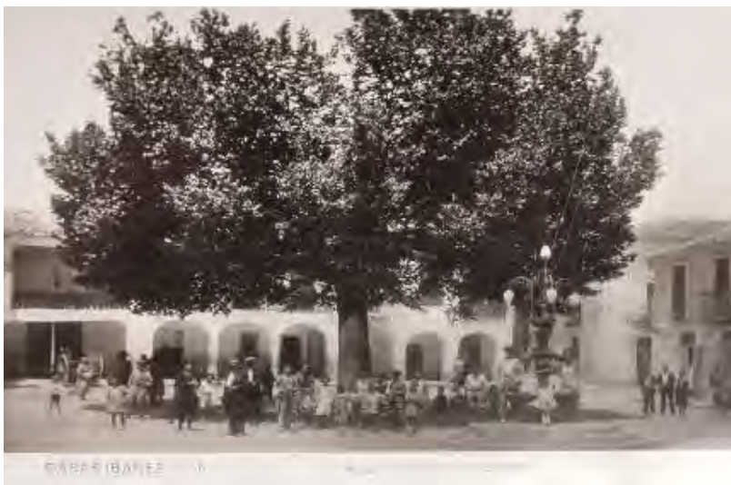
Foto de Luis Escobar. Plaza Mayor, en el año 1923, que se le puso el nombre de don Bonifacio Sotos. Ha sido escenario de los encierros taurinos y de la mayor parte de los festejos civiles y religiosos de la villa.

Por otra parte, la plaza de toros además de conseguir las finalidades propuestas también dotaba de mayor rasgo ornamental a Casas Ibáñez, que trataba de conseguir atraer a ella a los vecindarios de las poblaciones más cercanas, intento que resultaba fundamental para una villa que acababa de ser nombrada cabecera de comarca y como tal quería ser reconocida por sus convecinos.