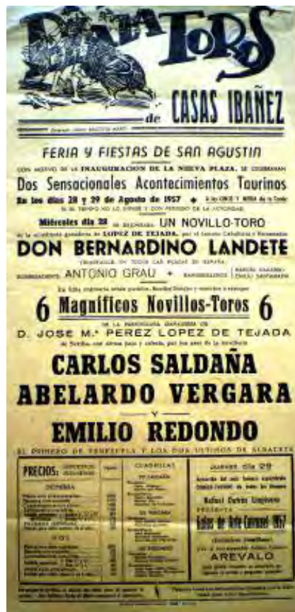
Cartel de la corrida de toros del 8 de agosto de 1957, día de la inauguración de la actual plaza de toros de Casas Ibáñez 15

El 28 de agosto de 1957, gracias al apoyo económico y técnico de un vecino de la localidad, Otelo Valiente, y del generoso esfuerzo de todo el vecindario, se consiguió levantar una nueva plaza que ahora cumple sesenta años.