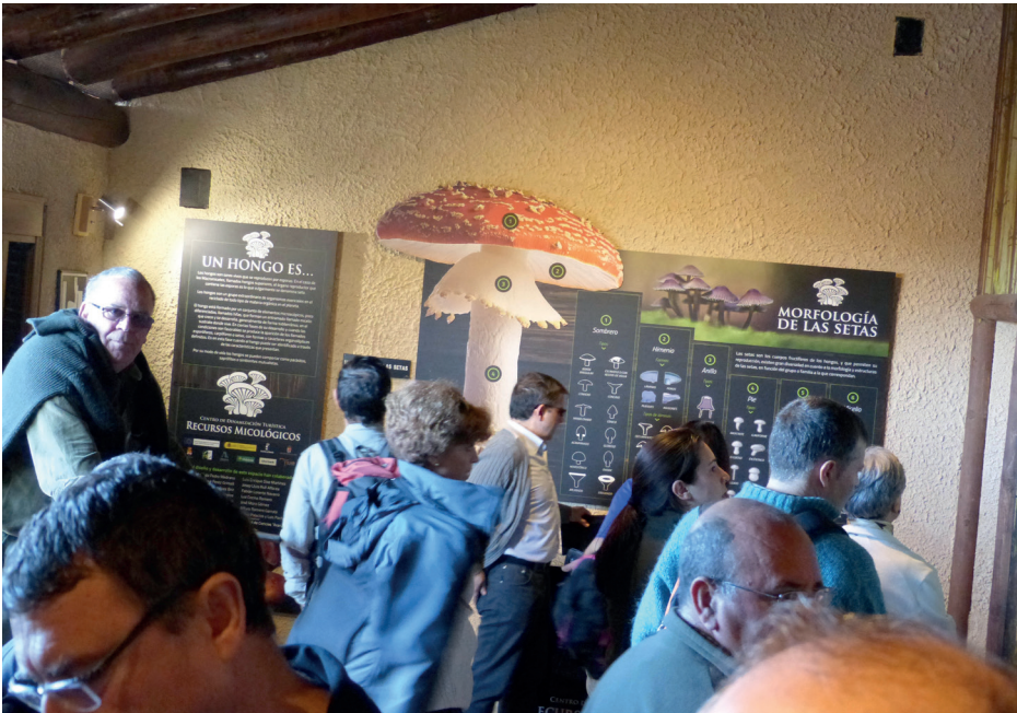
Figura 11. Visita al Museo Micológico de Cardenete (Cuenca), dentro de las actividades de la 20ª edición (2015).