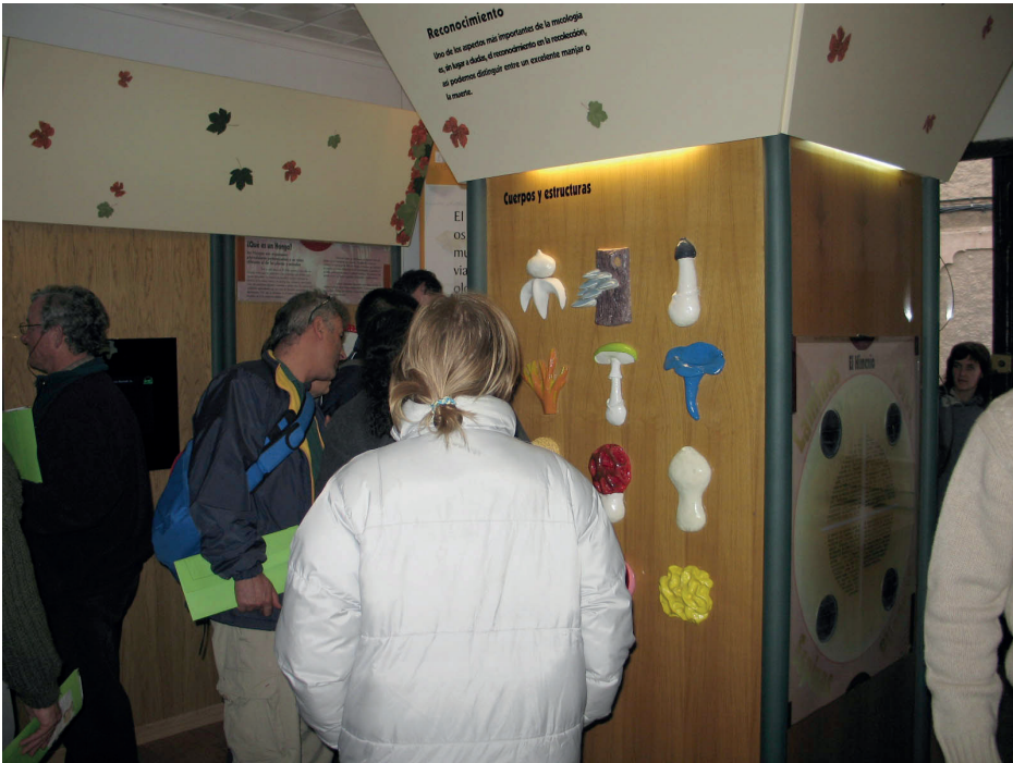
Figura 10. Visita a la “Casa del Nízcalo”, Museo Micológico de Molinicos (Albacete), visitado en varias de las ediciones de la Semana Micológica.