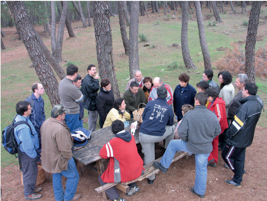
Figura 12. Explicaciones durante una excursión micológica en el nacimiento del río Cuervo (Cuenca), otoño de 2013.

Por otro lado, se realizan excursiones de fin de semana, dirigidas principalmente a los socios, pero abiertas al público en general. Dependiendo de la meteorología, se intenta realizar al menos una de otoño y otra de primavera. En ellas se hacen pequeños grupos guiados por compañeros de la SMA conocedores de la localidad concreta. Al finalizar se realiza una puesta en común del material recolectado, observado o fotografiado, haciendo un inventario de las especies que se han visto en la excursión. El material que pueda ser interesante se conserva para su estudio y registro en el herbario (figura 12). En los casos en que la excursión dura un fin de semana, se complementa con la exposición del material recolectado y realización de alguna charla en el alojamiento escogido (figura 15).