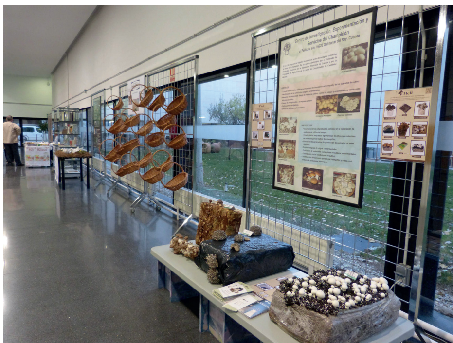
Figura 5. Algunos de los apartados de la exposición: muestra de cultivos de setas, aportados por el CIES y muestra de cestería (Cestería Marcilla, Lezuza).

Previamente a la semana micológica se convoca un concurso fotográfico de repercusión nacional cuyas obras premiadas se exhiben también en la exposición.