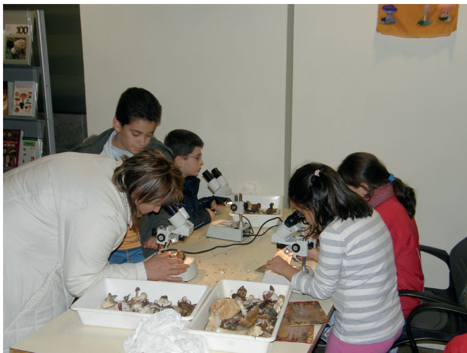
Figura 9. Taller de microscopía para niños, dentro de la exposición micológica durante la 13ª edición (2008).