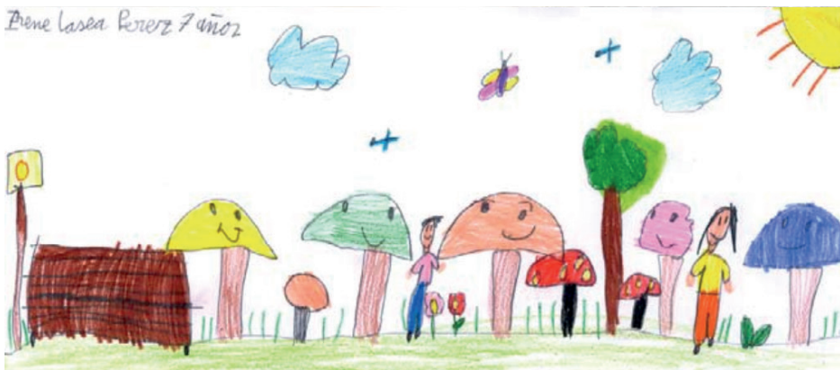
Figura 8. Dibujo de Irene Laseca Pérez (7 años), premiado en el concurso infantil de la 13ª edición (2008) y utilizado en la divulgación de posteriores semanas micológicas.