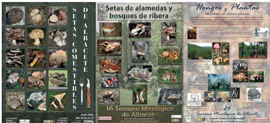
Figura 15. Pósteres publicados en las semanas micológicas de 2006, 2011 y 2019.