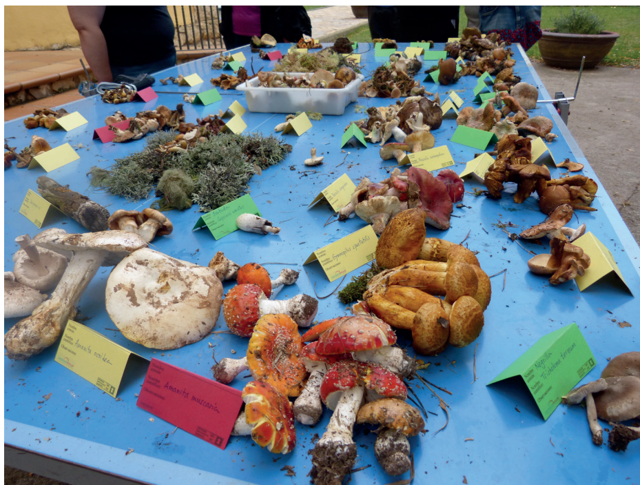
Figura 13. Exposición del material recolectado durante una excursión de fin de semana en la residencia de tiempo libre Padre Polanco, Orihuela del Tremedal (Teruel) en otoño de 2017.