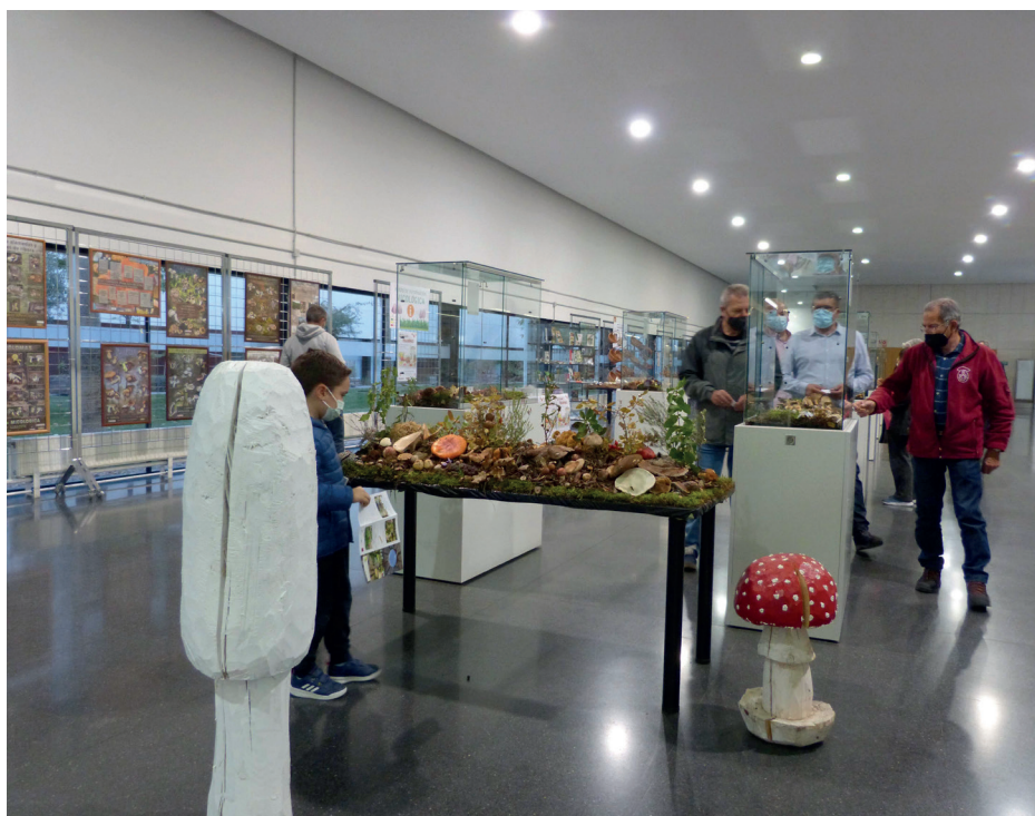
Figura 4. Exposición de la 25ª Semana Micológica de Albacete (año 2021), en el vestíbulo de la Casa de la Cultura José Saramago.

Aunque durante sus primeros años, el lugar de acogida de la semana micológica pasó por varias ubicaciones, desde 2009 se celebra en la Casa de la Cultura “José Saramago” , sede de la UP de Albacete (figura 4).