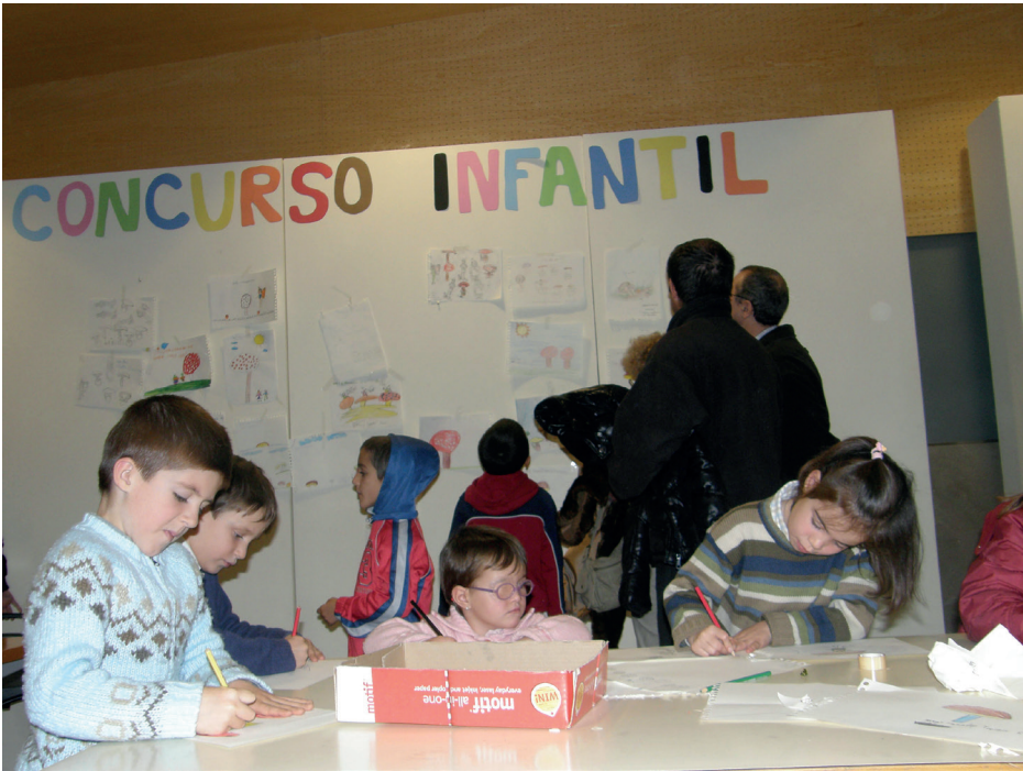
Figura 7. Taller de dibujo infantil de setas, dentro de la exposición micológica durante la 13ª edición (2008).