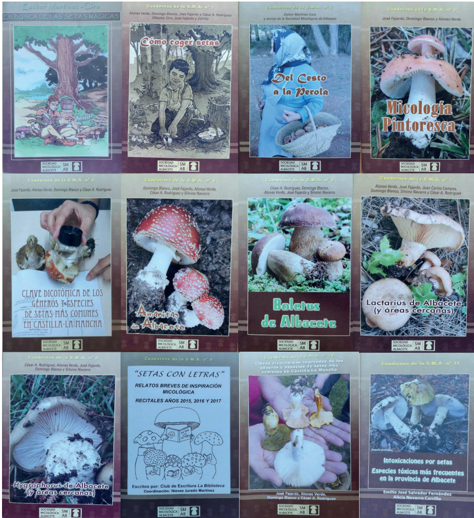
Figura 16. Portadas de los cuadernos divulgativos SMA, del nº 0 al 11