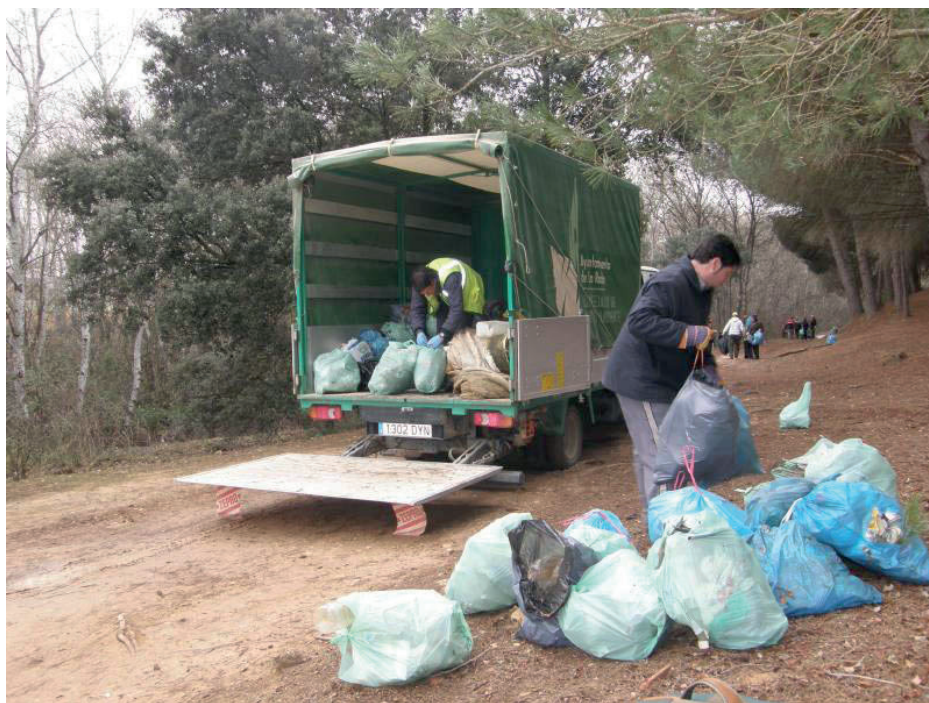
Figura14. Actividad de educación ambiental, realizada en marzo de 2009, en la que los socios de la SMA limpiaron de residuos una zona de la ribera del río Júcar.