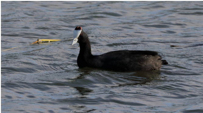
Figura 1. - Focha moruna en la laguna de Pétrola.

El objetivo de esta nota breve es proporcionar información actualizada sobre la reproducción de la focha moruna en los humedales de Albacete, contribuyendo así a un mejor conocimiento de la misma en Castilla-La Mancha y España. Todo esto se aborda desde una perspectiva de conservación, ya que en la Lista Roja de las aves de Europa (BirdLife International, 2021) y en el Libro Rojo de las Aves en España (Giménez, 2021), la focha moruna se incluye en la categoría En Peligro Crítico , con un riesgo extremadamente alto de extinción en estado salvaje debido al reducido tamaño poblacional y marcado declive en su área de distribución (Giménez, 2021). De hecho, tanto en Castilla-La Mancha como en España, la especie está considerada legalmente En Peligro de Extinción (respectivamente, mediante el Decreto 33/1998, por el que se crea el Catálogo Regional de Especies Amenazadas de Castilla-La Mancha; y el Real Decreto 139/2011, del Catálogo Español de Especies Amenazadas).