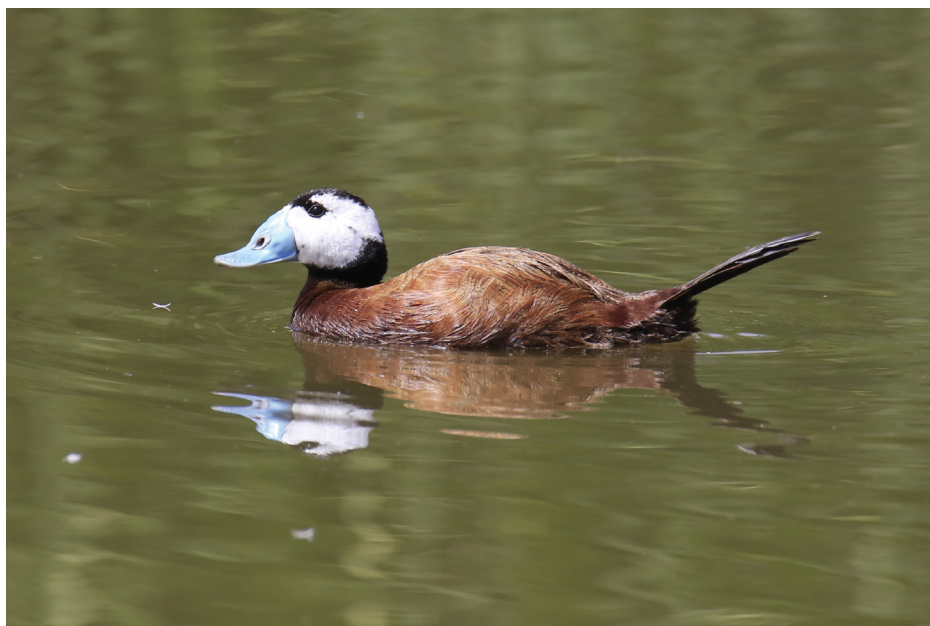
Figura 2. Malvasía cabecinegra, junio de 2022.