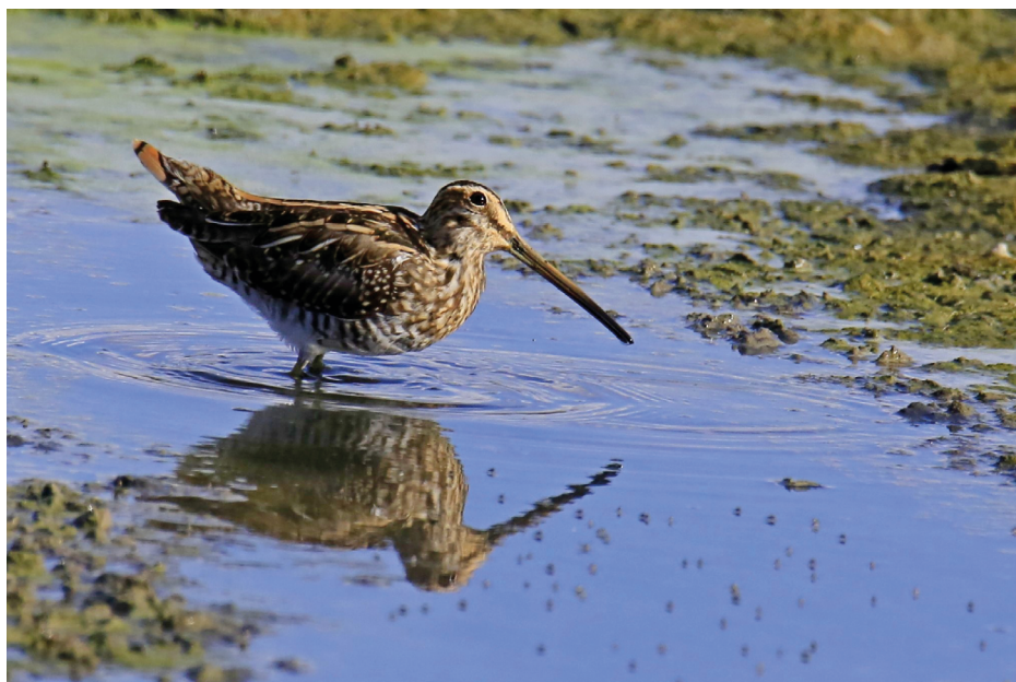
Figura 6. Agachadiza común, septiembre de 2022.