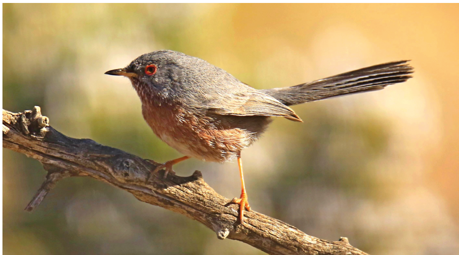
Figura 16. Curruca rabilarga, febrero de 2022.