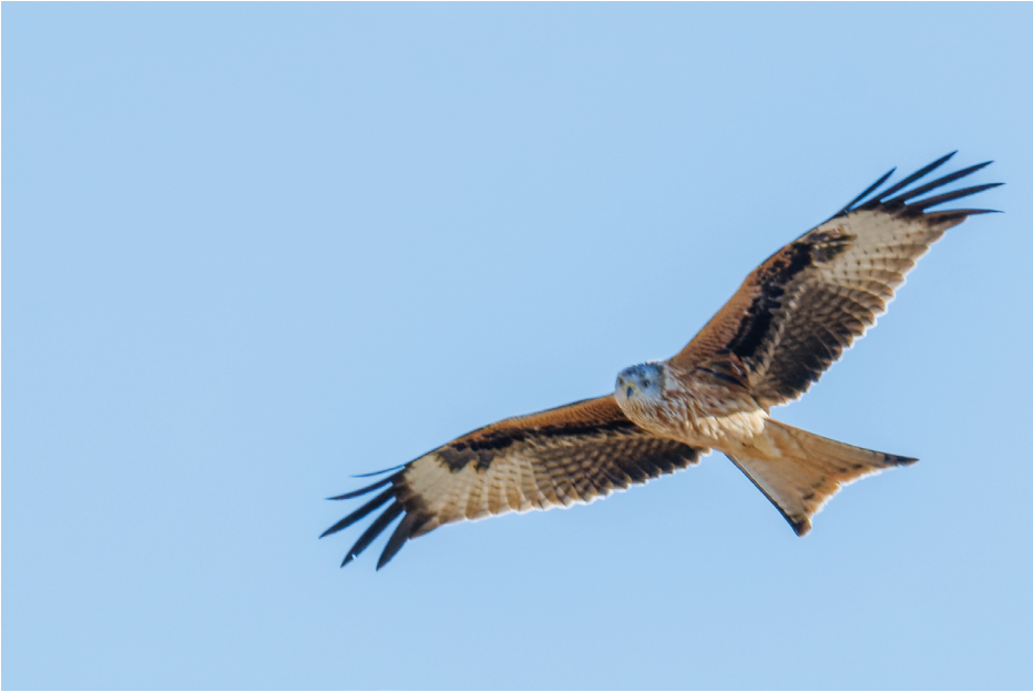
Figura 12. Milano real, noviembre de 2022.