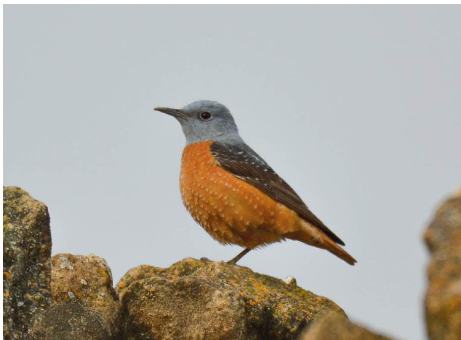
Figura 18. Roquero rojo, abril de 2022.

Año 2022: 1 en la laguna de La Higuera (Corral-Rubio), el 14 de abril (figura 18) ( Raquel Mansilla ); 2 en el centro de interpretación del parque natural de los Calares del Mundo y de la Sima (Nerpio), el 15 de abril, observados por Rafael Torralba ( eBird.org ).