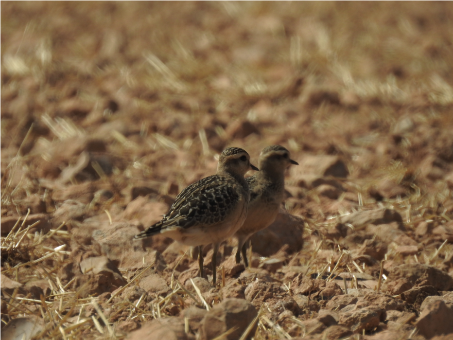
Figura 4. Chorlito carambolo, septiembre de 2022.