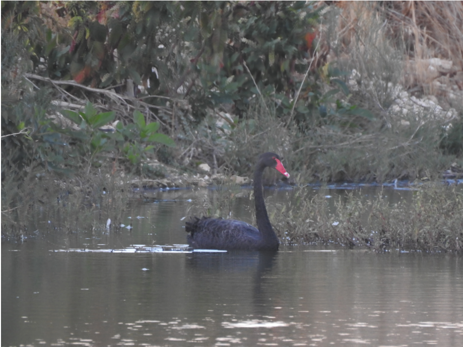
Figura 1. Cisne negro, septiembre de 2022.

Año 2022: 1 en la depuradora de Minaya (Minaya), el 16 de septiembre (figura 1) ( José Luis Escobar ).