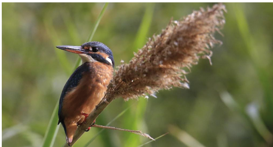
Figura 14. Martín pescador, agosto de 2022.