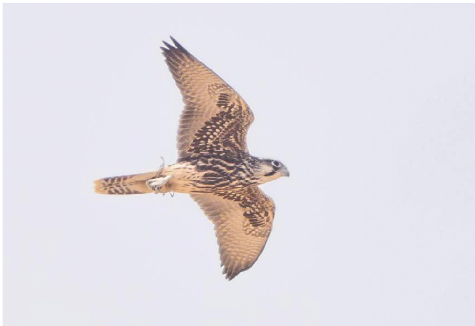
Figura 15. Halcón borní, julio de 2022.