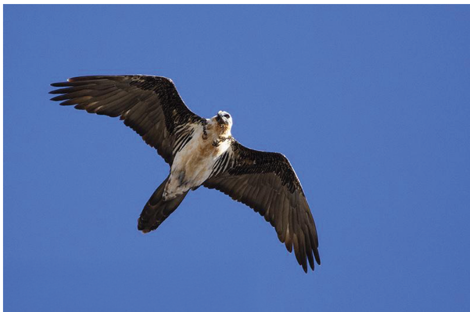
Figura 10. Quebrantahuesos, diciembre de 2022.