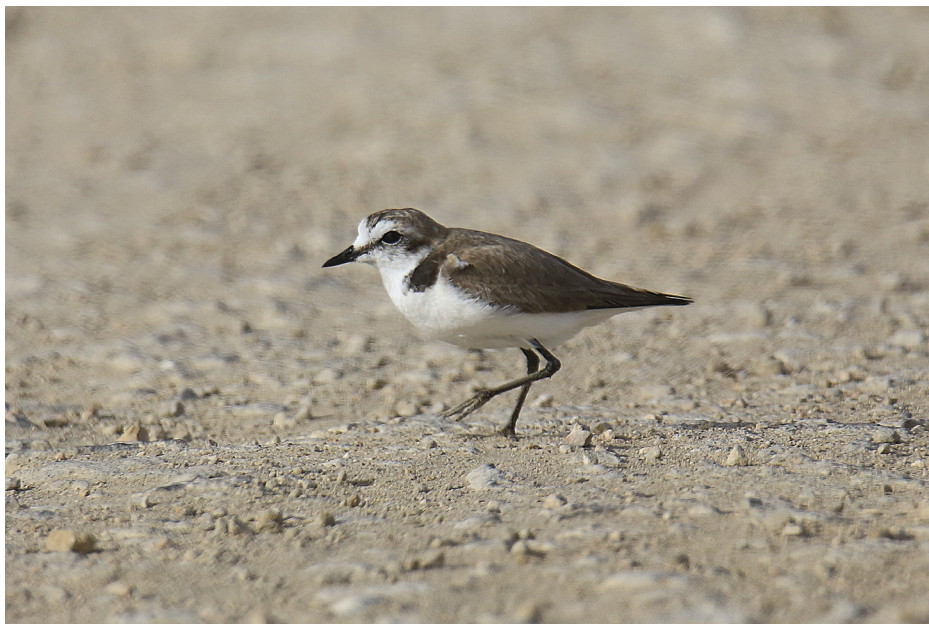
Figura 3. Chorlitojeo patinegro, junio de 2022.

la misma laguna, el 29 de diciembre, observado por Oriol Míquel, Júlia Cerveró y Míquel Biel ( eBird.org ); 3 también en la laguna de Pétrola, el 31 de diciembre, observados por Albert Sanz ( eBird.org ).