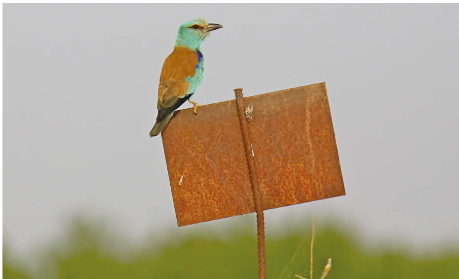
Figura 13. Carraca europea, junio de 2022. Fotografía: Ricardo Beléndez.