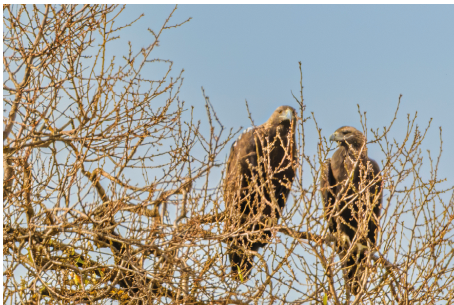
Figura 11. Águila imperial, diciembre de 2022.