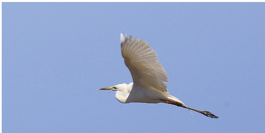
Figura 9. Garceta grande, abril de 2022.