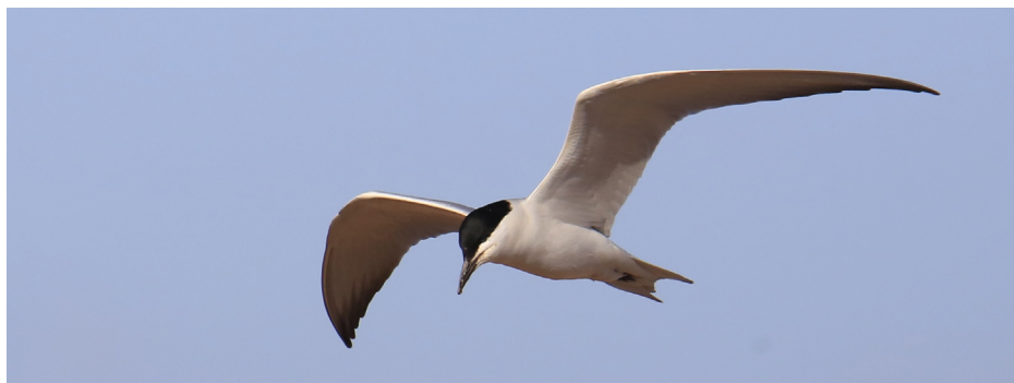
Figura 7. Pagaza piconegra, mayo de 2022.