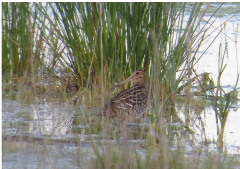
Figura 5. Agachadiza real, mayo de 2022.