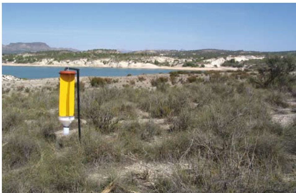
Fig. 2.- Trampa de intercepción de vuelo tipo ventana (TIV) colocada en la unidad de muestreo 13.