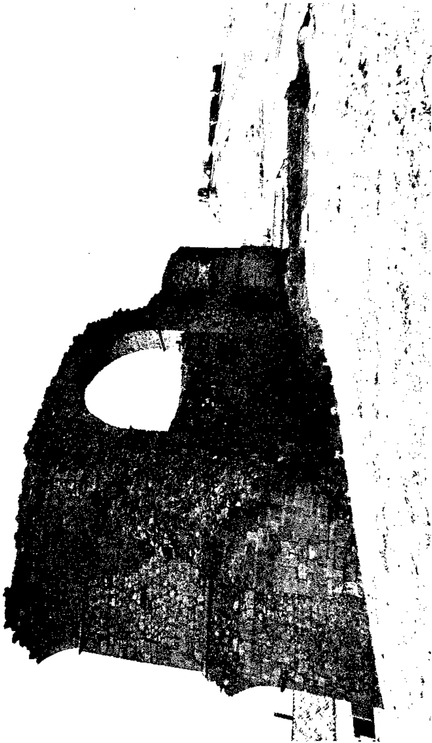
Foto 5: Acueducto para la conducción del agua, siglo XV-XVI. (José CANO VALERO)