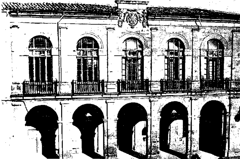
Fotos 2 y 3: Plaza Mayor de Alcaraz, siglo XVI.

Arriba: De izquierda a derecha, Torre de la Trinidad, Torre del Tardón, Convento de Santo Domingo o Lonja del Corregidor y Lonja de la Regatería.