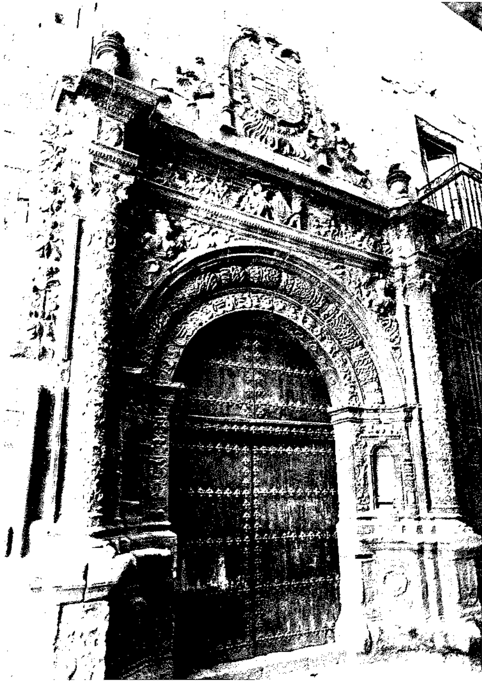
Foto 4: Puerta de la Aduana, siglo XVI.